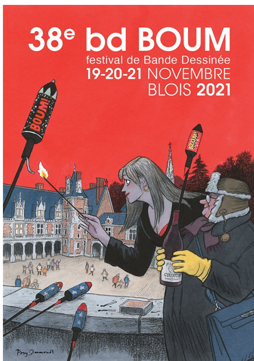
Affiche de Posy Simmonds, lauréate du Grand Boum ville de Blois 2020

Vous recevrez un dossier jeunesse courant septembre. N'hésitez pas à vous inscrire rapidement, les places étant limitées. Pour de plus amples renseignements, contactez notre service pédagogique au 02 54 42 49 22 ou bdboumjeunesse@wanadoo.fr