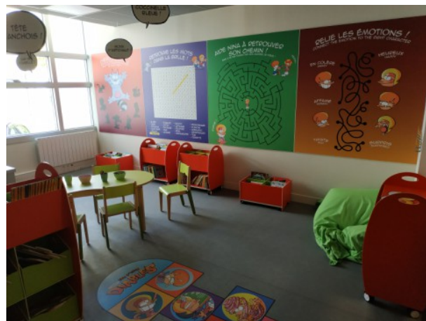
Nouvelle salle P'tits Diables (© Dutto – Ed Soleil)

En 2021, la Maison de la bd s'agrandit. L'espace pédagogique a considérablement été augmenté ! Une nouvelle salle consacrée à la jeunesse vient d'être créée . Un espace dédié aux mangas a également vu le jour.