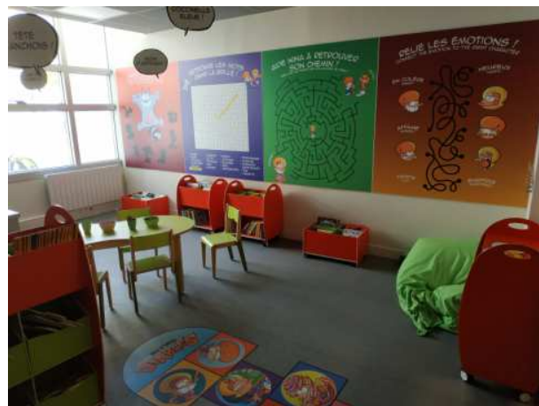
Salle P'tits Diables (© Dutto – Ed Soleil)

En 2021, la Maison de la bd s'est agrandie. L'espace pédagogique a considérablement été augmenté ! Une nouvelle salle consacrée à la jeunesse a été créée . Un espace dédié aux mangas a également vu le jour.